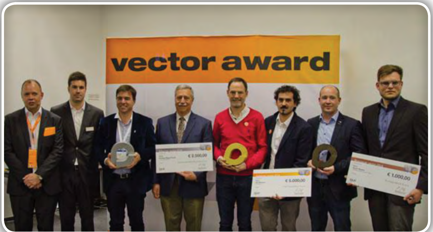
Zmagovalci mednarodnega natečaja Vector award 2018

Dva robota vrtata in kovičita trupe letal. Na vsako stran roke robota sta bili nameščeni dve energijski verigi. Rezultat tega je boljša dostopnost kljub zapleteni geometriji in velikemu